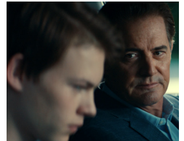
2018 FRANKY (Giant Little Ones) de Keith Behrman avec Josh Wiggins