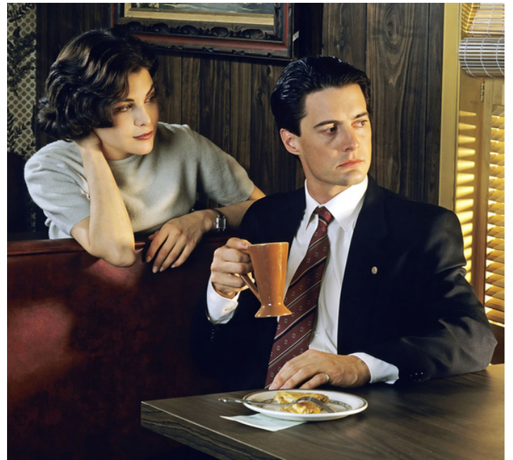
1989 QUIA TUÉ LAURA PALMER ? (Twin Peaks) de David Lynch avec Sherilyn Fenn