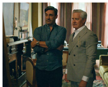
2022 AVOUE, FLETCH (Confess, Fletch) de Greg Mottola avec Jon Hamm