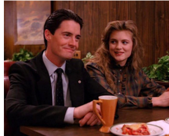
1990 MYSTÈRE À TWIN PEAKS (Twin Peaks) de D. Lynch et M. Frost avec Heather Graham