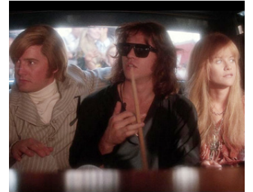
1991 LES DOORS (The Doors) d'Oliver Stone avec Val Kilmer, Meg Ryan