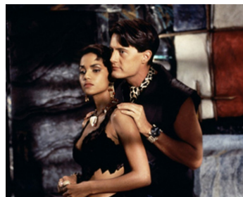
1994 LA FAMILLE PIERRAFEU (The Flintstones) de Brian Levant avec Halle Berry