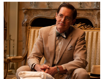
2020 CAPONE (Capone) de Josh Trank