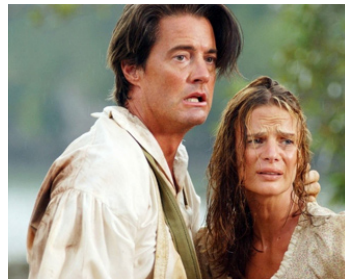
2005 L'ÎLE MYSTÉRIEUSE (Mysterious Island) de Russell Mulcahy avec Gabrielle Anwar