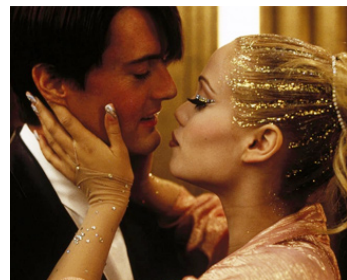
1995 SHOWGIRLS (Showgirls) de Paul Verhoeven avec Elizabeth Berkley