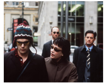
2000 HAMLET (Hamlet) de Michael Almereyda avec Ethan Hawke, Diane Venora