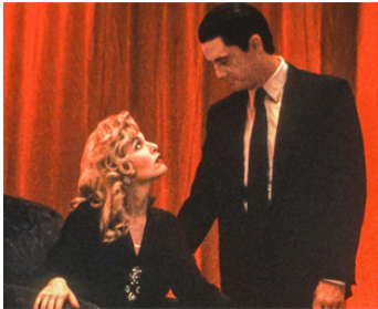
1992 LES 7 DERNIERS JOURS DE LAURA PALMER (Fire walk with me) de D. Lynch avec Sheryl Lee