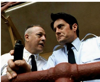
1994 LES RÉVOLTÉS D'ATTICA (Against the Wall) de John Frankenheimer avec Frederic Forrest