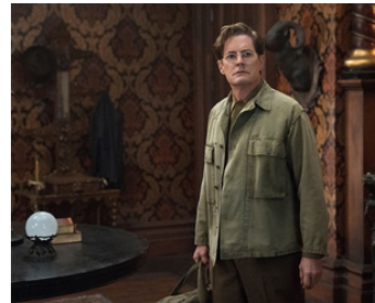
2018 LA PROPHÉTIE DE L'HORLOGE (The House with a Clock in its Walls) d'Eli Roth