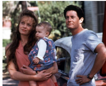
1993 L'AMOUR EN TROP (Rich in Love) de Bruce Beresford avec Suzy Amis