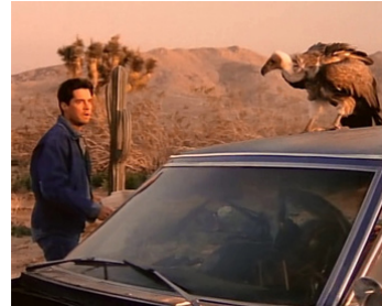
1991 LES CONTES DE LA CRYPTTE, Carrion Death de Steven E. De Souza