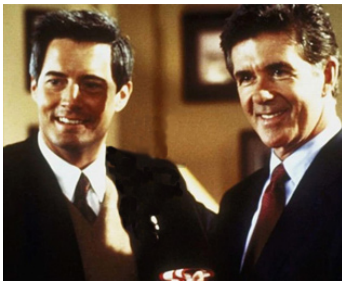
1998 LE PROTOCOLE WINDSOR (Windsor Protocol) de George Mihalka avec Alan Thicke