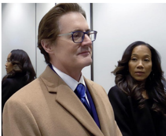
2019 HIGH FLYING BIRD de Steven Soderbergh avec Sonja Sohn