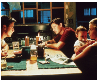
1996 RÉACTIONS EN CHAÎNE (The Trigger Effect) de D. Koeppe avec D. Mulroney, Elisabeth Shue