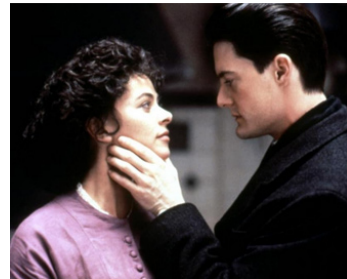
1993 THE TRIAL (The Trial) de David Hugh Jones avec Polly Walker