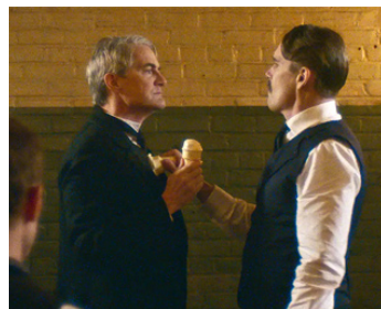
2020 TESLA (Tesla) de Michael Almereyda avec Ethan Hawke