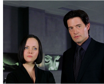
2002 MIRANDA (Miranda) de Marc Munden avec Christina Ricci