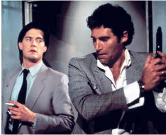
1987 HIDDEN (Hidden) de Jack Sholder avec Michael Nouri