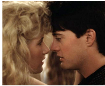
1986 BLUE VELVET (Blue Velvet) de David Lynch avec Laura Dern