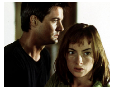
1998 THUNDER POINT de George Mihalka avec Pascale Bussièrès