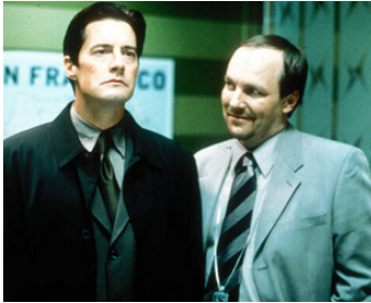
2001 XCHANGE (XChange) d'Allan Moyle avec Larry Day