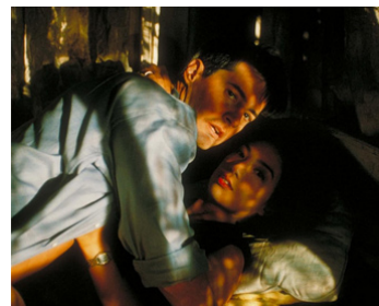
1997 POUR UNE NUIT... (One Night Stand) de Mike Figgis avec Wen Ming-na