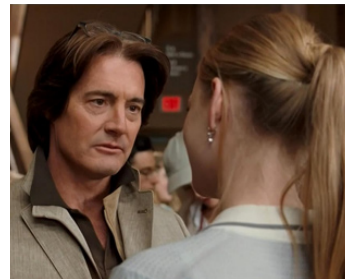
2008 4 FILLES ET UN JEAN 2 (The Sisterhood of the Travelling Pants) de Sanaa Hamri