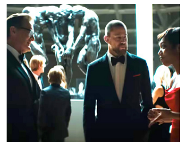
2024 BLINK TWICE de Zoé Kravitz avec Channing Tatum, Naomi Ackie