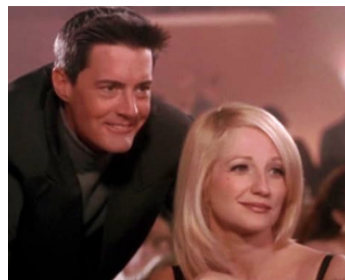
1996 MAD DOGS (Mad Dogs) de Larry Bishop avec Ellen Barkin