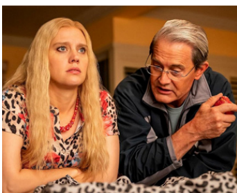
2022 JO VS CAROLE (Jo vs Carole) de Justin Tipping avec Kate McKinnon