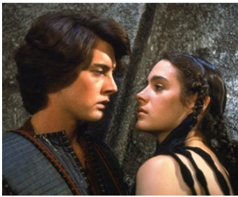
1984 DUNE (Dune) de David Lynch avec Sean Young