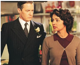
2004 UN SOUPÇON DE ROSE (Touch of Pink) d'Ian Iqbal Rashid avec Suleka Mathew