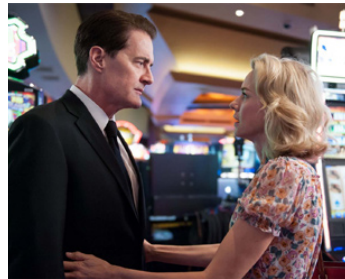
2017 RETOUR À TWIN PEAKS (Twin Peaks, the Missing Pieces) de D. Lynch avec Naomi Watts