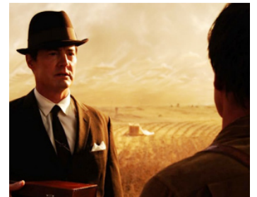
2009 LE PARFUM DU SUCCÈS (The Smell of Success) de M. Polish avec Billy Bob Thornton