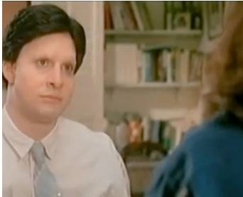
1990 UN LOOK D'ENFER (Don't tell her it's me) de Malcolm Mowbray