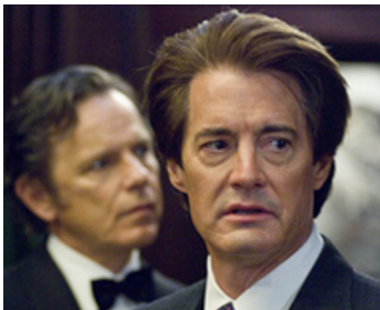
2009 MAO'S LAST DANCER de Bruce Beresford avec Bruce Greenwood